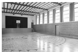
Tanzplatz / Dancehall

Ur- und Frühgeschichte: Auf Reimlingens Flur – wie übrigens im ganzen Ries - ist durch Grabungen und Funde eine sehr frühe Besiedelung nachgewiesen. Es sind dies die drei Epochen: das Neolithikum und die Hallstadt- zeit A und C. Gelegentlich werden auch heute noch in der Feldflur bearbeitete Steine (Beile und Pfeilspitzen) aus jener Steinzeit gefunden. Zwei römische Landhäuser (Villa Rustica) sind in Reimlingen durch Grabungen bestätigt.