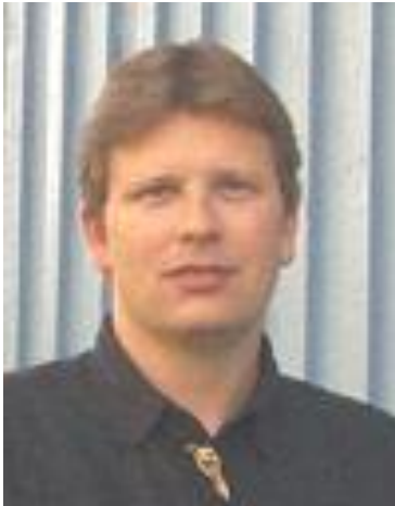
Calling Beginners thru C4